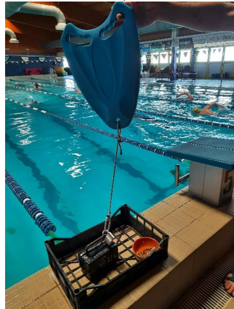
Cesta al punto E